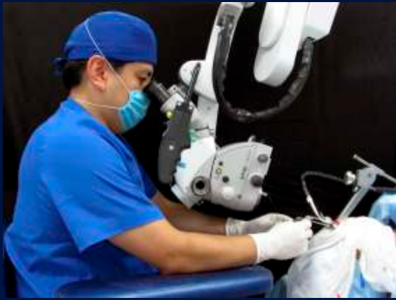
Cirugías en Vivo: La mejor forma de aprender